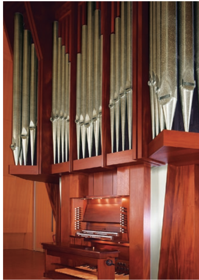
2006年 C.B. フィスク社製作