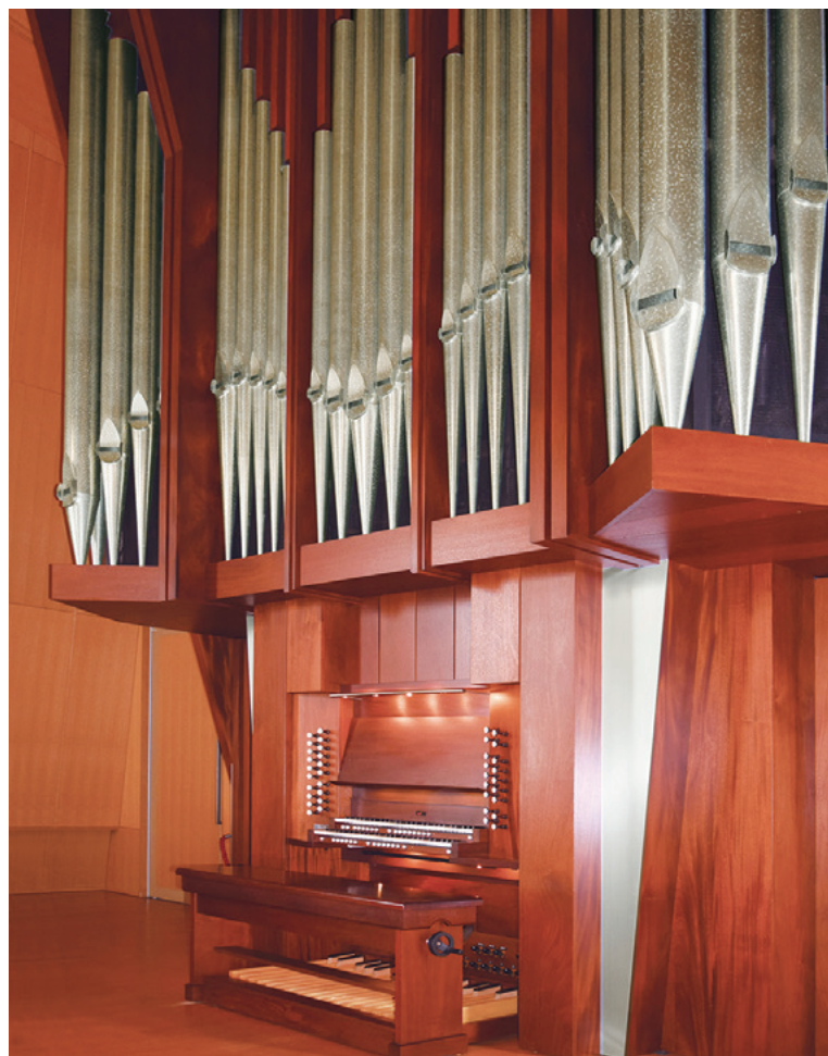
パイプオルガン「ルナ」