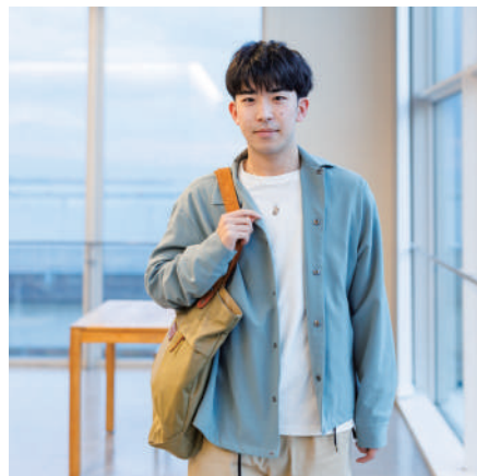
リハビリテーション学部 理学療法学科

指定校推薦入試では、面接対策が重要なので面接の練習をたくさんしました。 練習はひとりでもできますが、やはり相手が必要なので高校の先生に面接官を頼みました。それも一人ではなく複数の先生にお願いして2対1、3対1のより実践的な形式の面接練習も行いました。 またよく聞かれる質問を想定して理学療法士という職業について認識にズレが出ないように詳細を調べ、回答に矛盾が生じないように気をつけました。 実際の面接試験では、とても緊張しましたが、繰り返し練習したことで自然と言葉が出て、自分が思っていた以上の力が出せ合格につながりました。